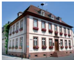
Ратуша на Марктплатц

В годы расцвета возникло множество красивых домов дворянства и знати, которые (прежде всего, в Амтсгассе) до сих пор формируют облик города.