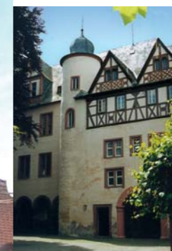
Внутренний двор замка

Бабенхаузен — железнодорожный узел на участках Дармштадт–Ашаффенбург и Ханау–Оденвальд. До города можно легко добраться по автобанам и отходящим от них дорогам.